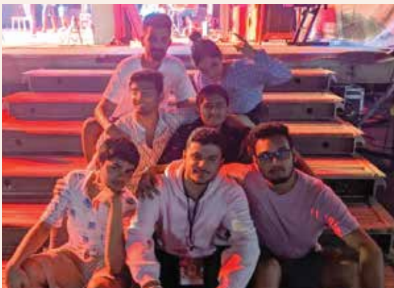
In Search of Space: the Ramaiah band