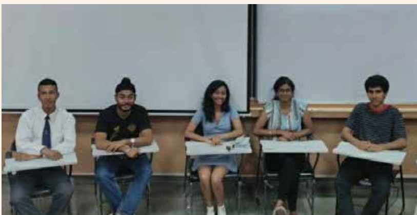
The Literary Team at JAM