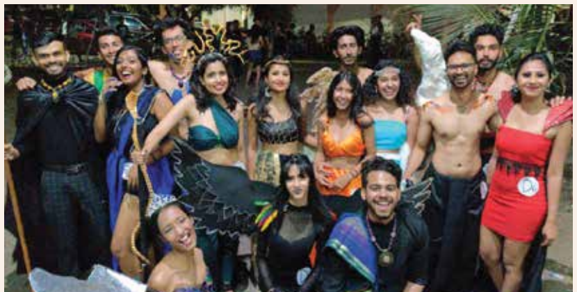
The Ramaiah Fashion Team: The Seven Deadly Sins