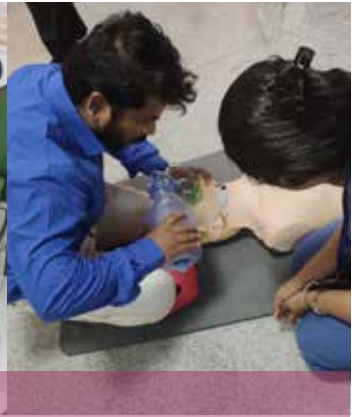
The Department of Emergency Medicine, Ramaiah Medical College conducted Basic Life Support Programme to Interns, Post Graduates, Physiotherapy, PU College Lecturers, and Homoeopathy Doctors on February 18, 2020 at MEU Seminar Room.