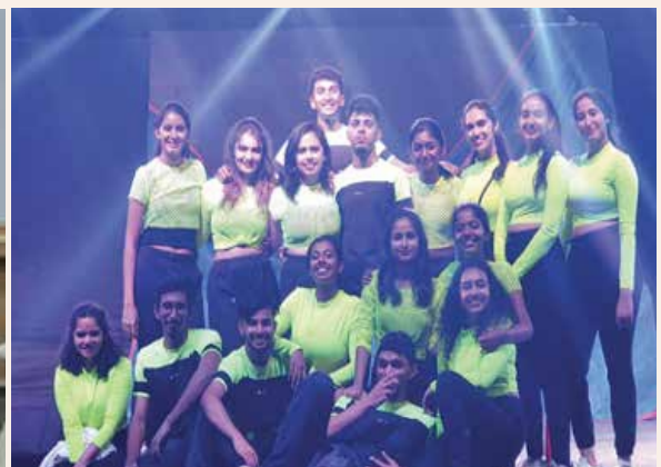
The Non-Theme Dance Group